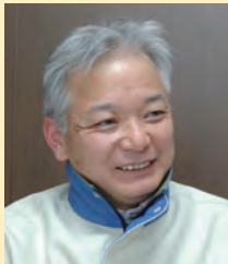
共同印刷西日本株式会社 営業企画部システム課 課長

そこで共同印刷西日本は、データ通信インフラの見直しを検討することにした。選定要件には、使い勝手の良さや、