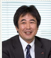
九州旅客鉄道株式会社 総合企画本部 IT推進室 主査