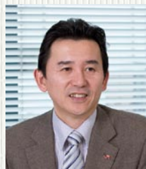
九州旅客鉄道株式会社 総合企画本部 IT推進室 室長

JR九州は内部統制対策を目的にシステムの「標準化」を推進。その一環としてデータ連携の標準化ツールにHULFT及びHULFT-HUBを採用し、多様なシステムをつなぐデータ連携基盤を構築した。これにより、運用管理手法が統一され、システム基盤が整った。また複数のHULFTを統合管理する仕組みも整備され、システム間の連携度が向上。データ転送設定作業の効率化とシステムの安定運用を実現している。